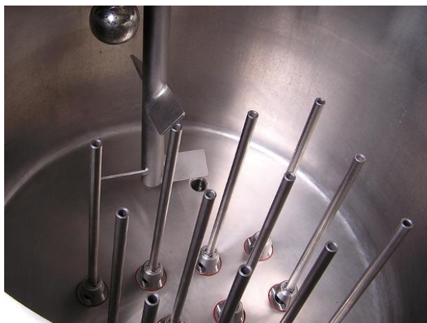
MBF12 – pohled dovnitř zásobní nádoby

Prospekt je pouze informativní, zařízení lze upravit dle požadavku a přání zákazníka.