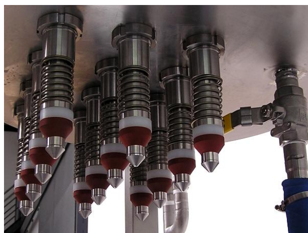
MBF12 – spodní pohled na plnicí trysky